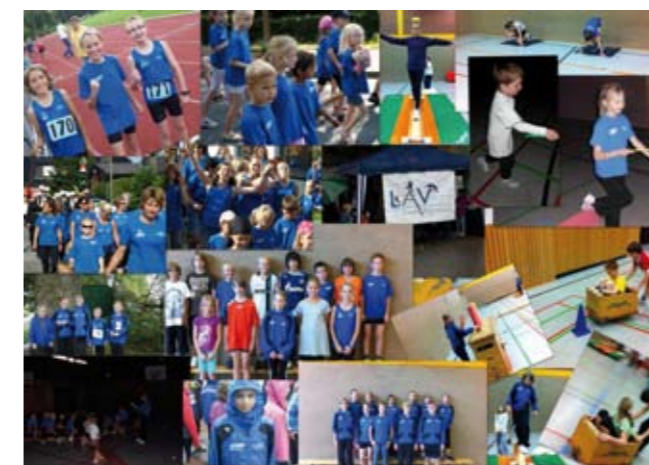
Der LAV nahm an zahlreichen Veranstaltungen im Jahr 2010 teil. Neben dem üblichen Trainingsbetrieb und den vielen Wettkämpfen waren wir mit einer großen Gruppe beim Kirmesumzug vertreten. Durch einen Stand beim Pfarrfest unterstützten wir die örtlichen Projekte.