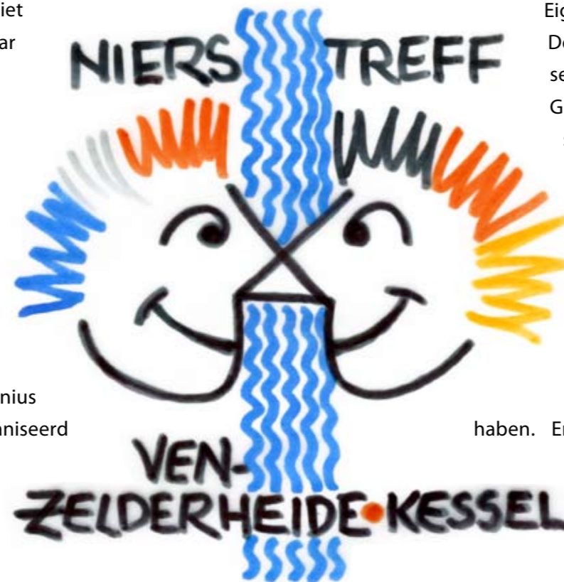
Entwurf: Haro Ross

Wanneer? 11. september 2011 vanaf 11.00 uur op Landgoed Zelder. Het initiatief tot dit treffen werd genomen door het kerkbestuur van de parochie H. Antonius Abt. Nierstreff wordt georganiseerd door de verenigingen van Ven-Zelderheide en Kessel en wordt mede mogelijk gemaakt door ondersteuning van de Euregio-Rijn-Waal.