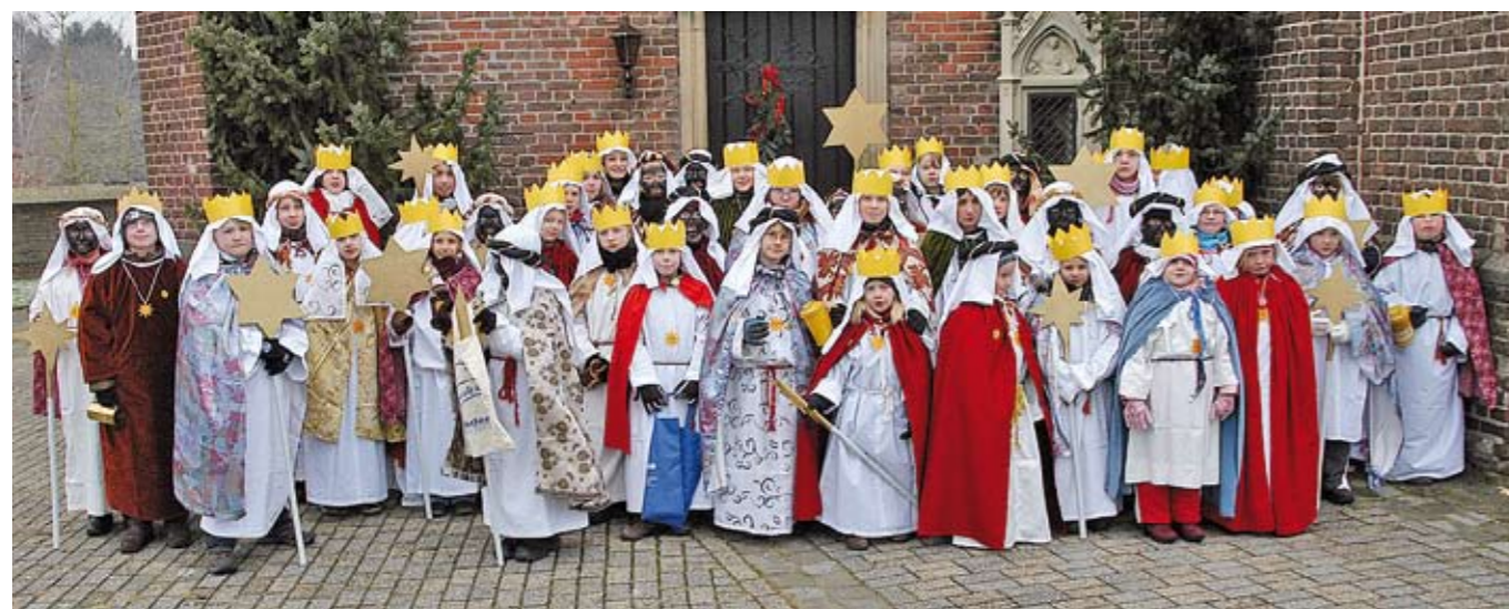
Sternensinger Januar 2010

Der Förderkreis unterstützt die Aktivitäten des Verkehrs- und Heimatverein Kessel seit seiner Gründung im Frühjahr 2002.