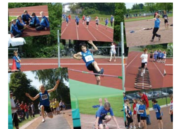
Zehn Kreismeistertitel und eine Menge vordere Platzierungen haben unsere Athleten errungen. Kessel hat sich zwischenzeitlich in der Leichtathletikszene etabliert.